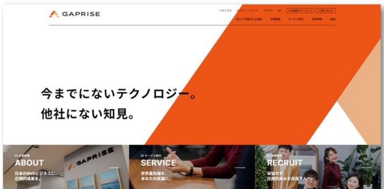
リニューアル後の TOP ページ